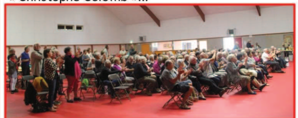
Le public enthousiaste fut conquis