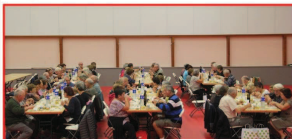
Vue partielle des convives

Jambon de pays - Blanquette de veau - Gratin dauphinois - Fromage - Salade de fruits - Vin rouge ou rosé - Café.